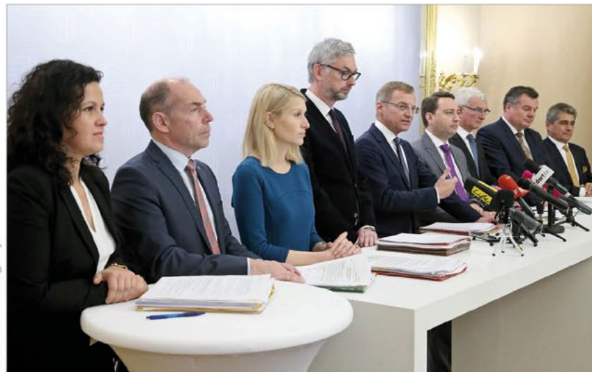
Landeshauptmann Thomas Stelzer hat mit seinem OÖVP-Regierungsteam sowie gemeinsam mit dem Koalitionspartner den Landeshaushalt 2018 vereinbart.

„Mit dem Landeshaushalt 2018 machen wir zum ersten Mal seit 2010 keine neuen Schulden. Erstmals seit 15 Jahren bauen wir sogar Schulden ab. Damit schaffen wir wichtige finanzielle Spielräume, um in Zukunftsschwerpunkte für Oberösterreich zu investieren.“