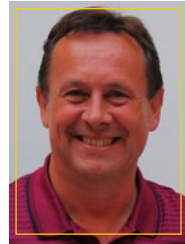
Bürgermeister Ernst Lehner