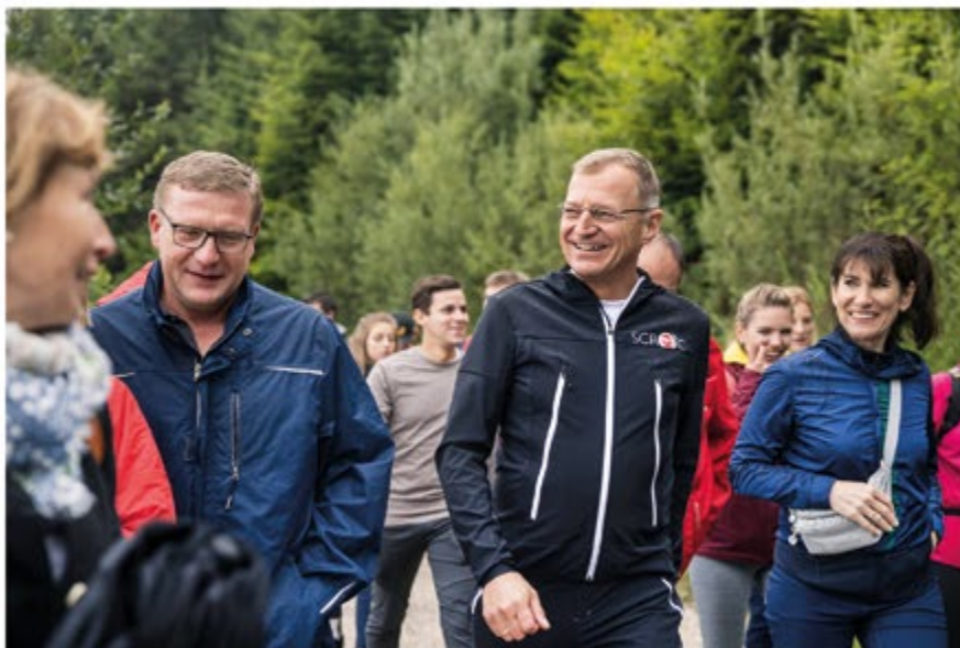
Landeshauptmann Thomas Stelzer möchte das Miteinander im Land weiter stärken.

Dazu organisiert die OÖVP den ganzen Sommer über in allen Regionen des Landes Veranstaltungen und Gelegenheiten zum gemeinsamen Austausch unter dem Motto „Sommer des Miteinanders“.