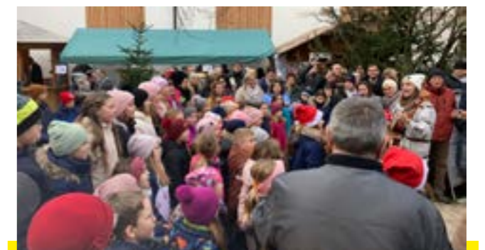
Zahlreiche Besucher aus Katsdorf und den umliegenden Gemeinden kamen zum traditionellen Adventmarkt, um sich von über 60 Ausstellern und einem bunten Rahmenprogramm auf Weihnachten einstimmen zu lassen.