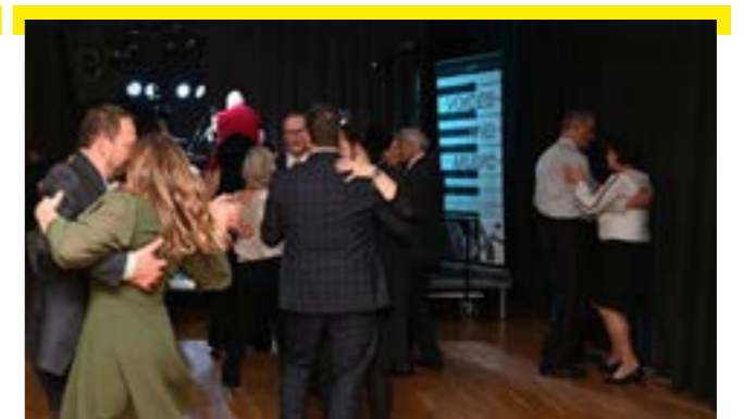
Mehr als 500 Ballgäste sorgten im restlos ausverkauften Gemeindezentrum "IM HOF" für reges Treiben und beste Stimmung.