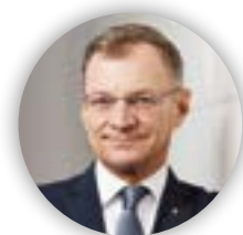
Thomas Stelzer Landeshauptmann

„ Wir können nicht beeinflussen, was auf der Welt passiert. Aber eines ist sicher: Auf Oberösterreich ist Verlass. “